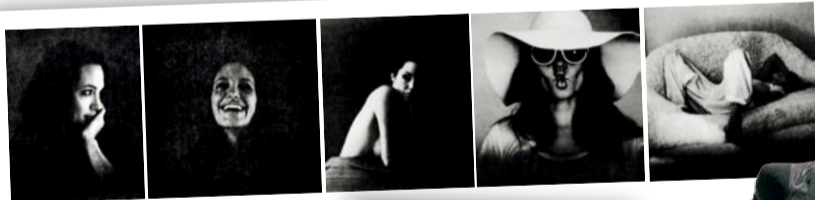
布拉德·皮特眼中的朱莉是怎样的，这一组摄影作品正是最好的说明

然而，不结婚也总找来更多猜疑。于是，两人，一不做二不休，索性先付个定金——订婚先。便有了年初两人公开表示已经订婚的场面，而这一场订婚也是来之不易，因为这对好莱坞最大牌的明星情侣此前曾坚持除非同性婚姻在全球合法，否则两人不会结婚，但随着孩子们的成长，两人承认来自孩子的压力越来越大，这也很可能是两人最后做出这个决定的主要原因。