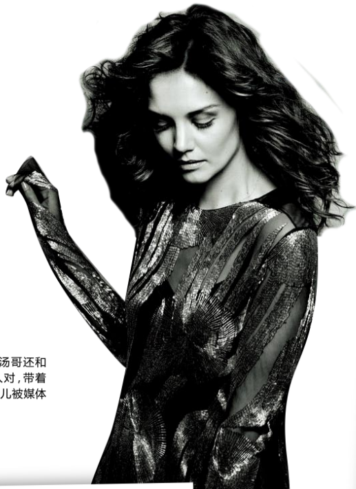
不久前，阿汤哥还和凯蒂成双入对，带着可爱的小女儿被媒体争相拍照