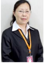
红娘档案：佳美 百合网资深婚恋顾问