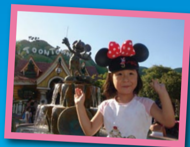
米奇和我们一起欢笑 多多，10岁