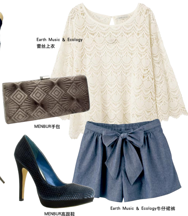
Earth Music & Ecology 蕾丝上衣

牛仔攻势在春夏总是来得猛烈，而好搭的单品牛仔裙裤的点击率算是最高的。同样，今年的短裤式样中卷边与高腰花苞款都是热门。尤其是带着雪花纹理的单宁布与露趾高跟鞋的刚柔混搭，聪明女人的俏丽装扮瞬间就能俘获人心。哪怕是眼角多几丝小小细纹也会在腾挪回转头，转化为女人最妩媚的风情一刻。