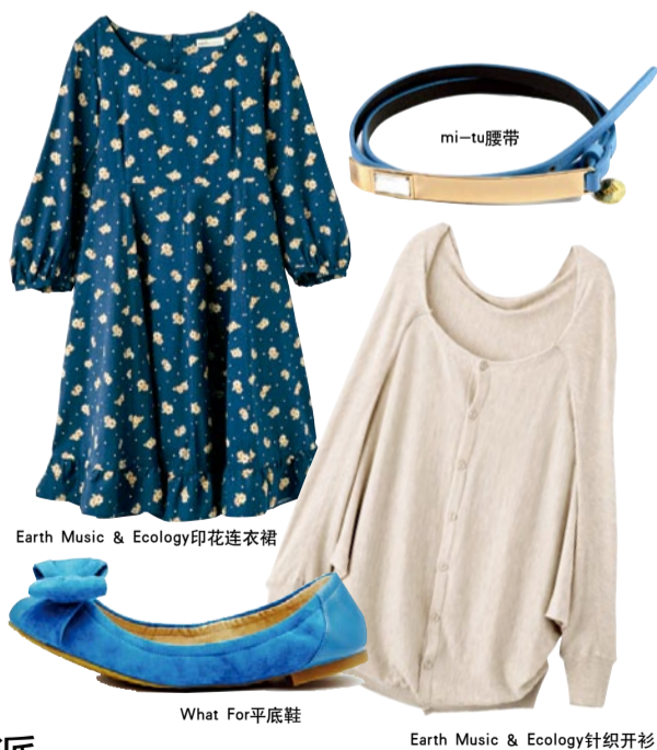
Earth Music &amp; Ecology印花连衣裙