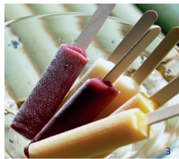
1.打针西瓜 2.学生自制明胶酸奶 3.含有明胶不化的棒冰