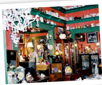
小镇上的每家小店都值得细细品味。

看到马路中间的花基, 让我想起西方人在阳光和煦的日子里来到公园草坪野餐的画面, 那我何不在这落花缤纷中享受难得的“花之午餐”呢! 花基里种的不知道是什么花, 有点像紫荆花, 又有点像樱花, 春风带着粉紫的花瓣不断地“亲吻”我的手、我的脸、我的嘴……超萌。小孩子们在玩具店里乐开了怀, 糖果店里各年龄层的客人在面对五颜六色的糖果不知如何下手, 当然这其中也包括我。有人在咖啡店外坐着, 边品咖啡边沐浴阳光, 有人就直接坐在绿化带上享受阳光的洗礼, 而还有更多像我一样的游客则穿梭在每一家小店里, 欣赏从维多利亚时代欧洲宫廷风格的家饰到现代简约风格的家具。