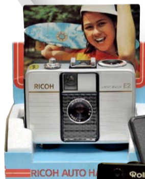
Ricoh Auto Half E2