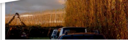
落日下的果园防风墙