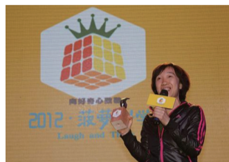
菠萝奖部分获奖项目图示