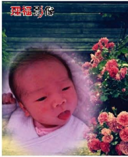
▲小钦钦，自2012年3月2日你生命翻开的第一页开始，你就成了爸爸妈妈在这个世界上最爱的男人!