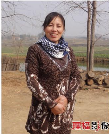
▲日光给您镀上美丽，月华增添您的妩媚，在您生日来临之际，愿侄女的祝福汇成你快乐的源泉祝你一生快乐。