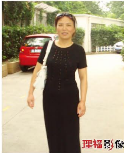
▲母教导，深入内心；母善语，倾听入耳；母亲行，刻入眼眸；母海言，受用一生。妈妈，祝你生日快乐。