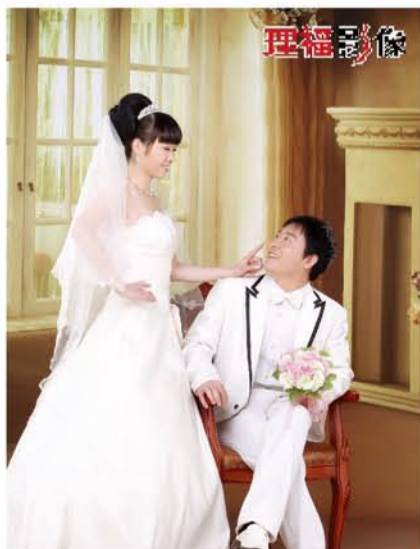
▲我会珍惜和你在一起的每分每秒，好好守护你一辈子。