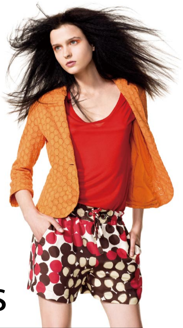
UNITED COLORS OF BENETTON

说得通俗点,深色穿搭法会让自己增加一点分量感。无论是军绿、姜黄、深紫、藏蓝还是摩卡色,一旦你的服装搭上这些色彩,其余的颜色都会自动变为“配角”。需要注意的是,和这些很抢眼的颜色搭配时,控制其在整体服装上的比例,是显出你时尚功力的关键所在。