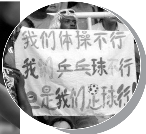
▲2008年北京奥运会尼日利亚球迷举标语。