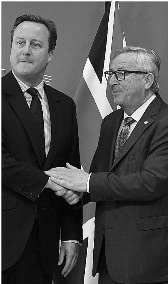
英国首相(左)与欧盟委员会主席容克会晤。

一名外交消息人士透露,自英国“脱欧”公投后,每天有超过4000名英国民众向爱尔兰驻英国使馆申请爱尔兰护照,而以往每天只有200人