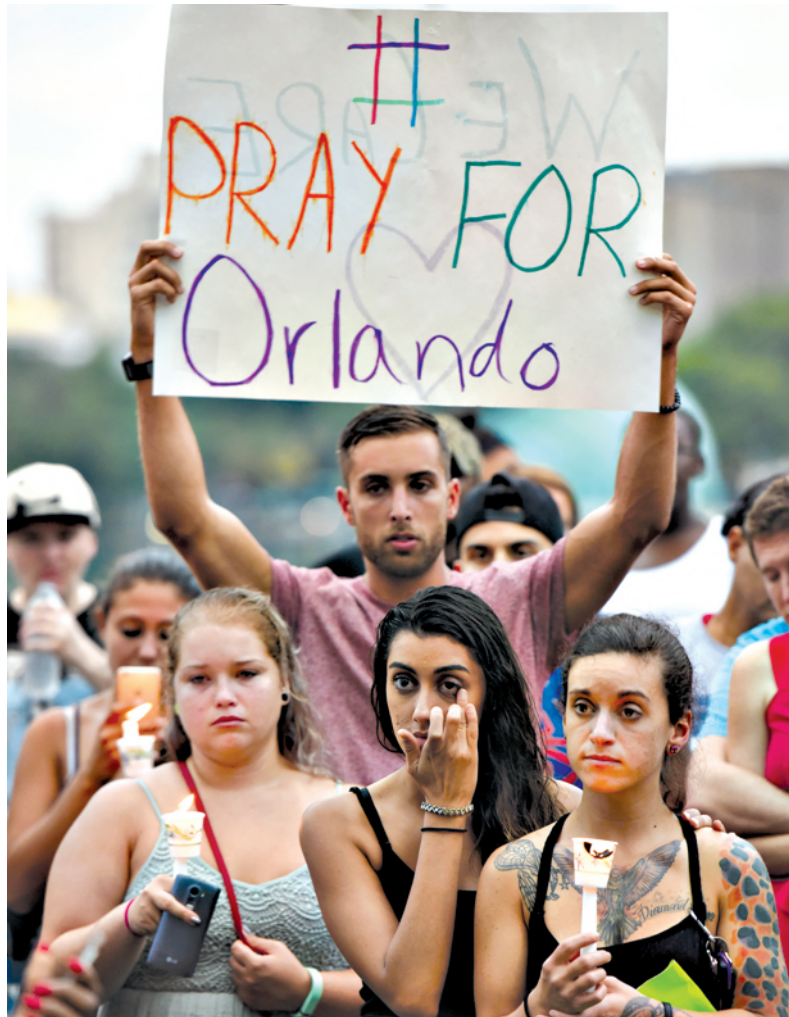
6月12日，在美国奥兰多市，人们为枪击案遇难者哀悼。