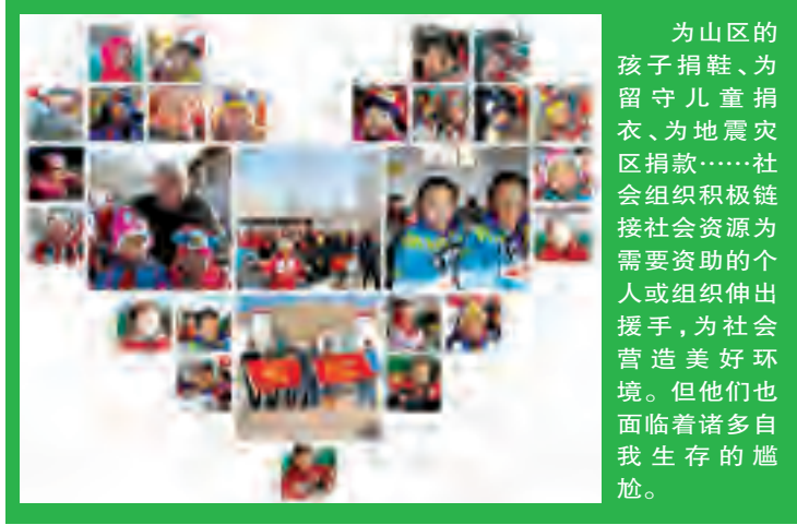
为山区的孩子捐鞋、为留守儿童捐衣、为地震灾区捐款……社会组织积极链接社会资源为需要资助的个人或组织伸出援手,为社会营造美好环境。但他们也面临着诸多自我生存的尴尬。

首先,只有按照自愿和无偿原则依法接受的用于公益事业的捐赠,才可以开具捐赠票据,决不能将捐赠票据用于集资、摊派、筹资、赞助、服务等行为。其次,要规范使用票据。要认真学习《暂行办法》,按照《暂行办法》的规定使用和保管捐赠票据。