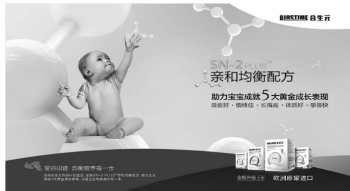
合生元 SN-2 助力宝宝成就“5大黄金成长表现”

为符合“领先的高端家庭营养及护理供应商”的新定位，合生元将“合生元事业部”、“素加事业部”及“葆艾事业部”整合成“婴儿营养及保健事业部”，并设立专门的Swisse中国事业部，以支持Swisse在中国的业务拓展。同期，妈妈100电子商务平台的定位调整为内部服务平台，致力于集团产品的专卖及营