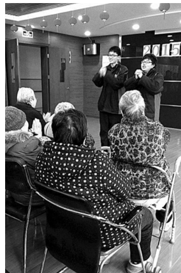
志愿者为老人表演相声。