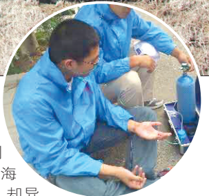
工作太累了,坐下来吸口氧。

按照中央援藏省市对口援藏地市、非援藏省市统一调配各地市、志愿者专业尽量专业对口等原则,毕业于上海高校的青年志愿者们分配到拉萨、日喀则市的各个基层条线上班。除了完成本职工作外,志愿者们还自愿担当着西藏扶贫助残、生态环保等任务。