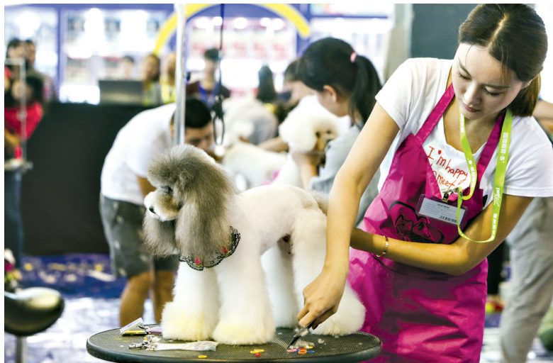
宠物展上各路萌宠齐聚。

在鲤鱼区,有千余条锦鲤鱼集中亮相,市民可在现场鉴赏“水中游艺艺术品”的过程中,了解锦鲤养殖技艺。