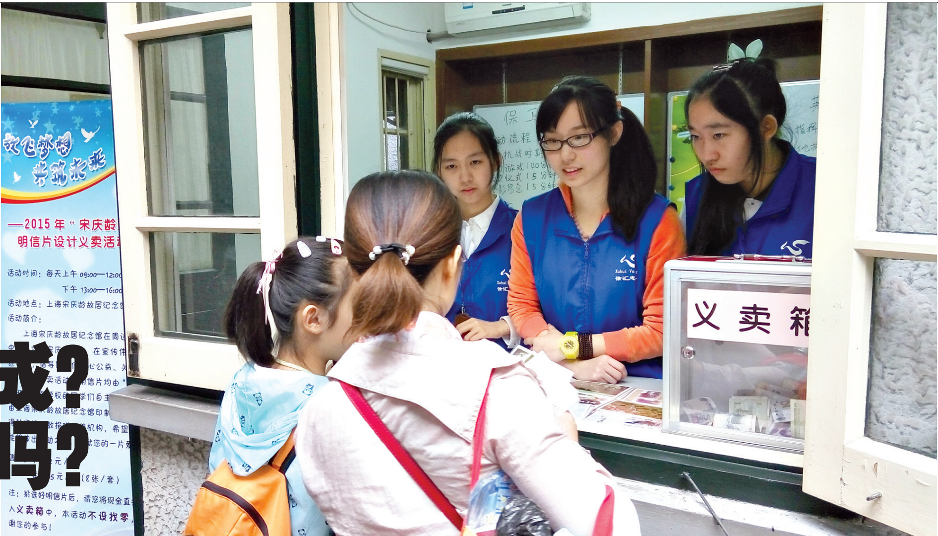
志愿者们在宋庆龄故居纪念馆内进行明信片义卖。