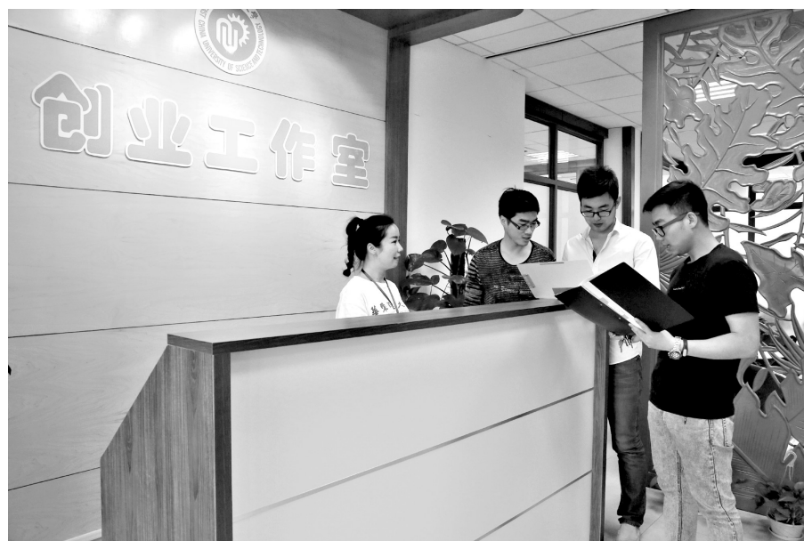
华东理工大学开设创业工作室。