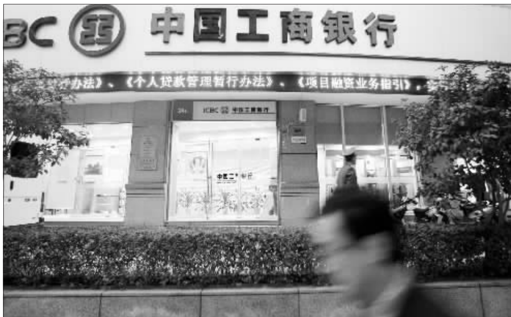
青年报资料图 记者 马骏 摄