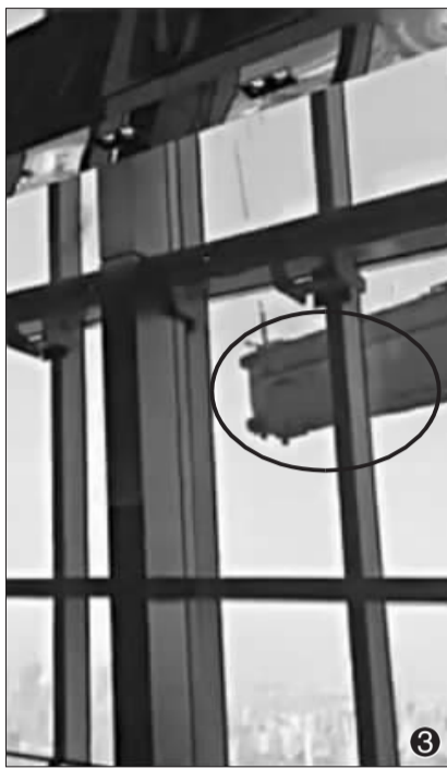
①被砸碎的玻璃。 ②楼底拉起了警戒线。 ③吊篮撞击窗玻璃瞬间。 青年报记者 施培琦 摄 视频截图

8时03分左右,轻生女子突然情绪失控,将下半身伸出墙外,仅用双手抓住墙沿挂在墙边。见形势危急,在女子不远的许伟国果断跳出窗外,在女子坠落前一刻,拉住其手臂,后通过屋内另两名消防员协力将轻生女子安全救起。