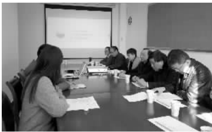
班级代表们在参加申请无人监考答辩会。

13级国防刑侦班班长、学习委员和团支书三名同学曾共同亲历现场申请答辩会。“我们制作了名为《道德与利益一念抉择》的PPT,陈述我们申报理由与实施方案,我们觉得,当真正去实施的时候,我们一定能收获比一场‘无人监考’这个形式更为重要