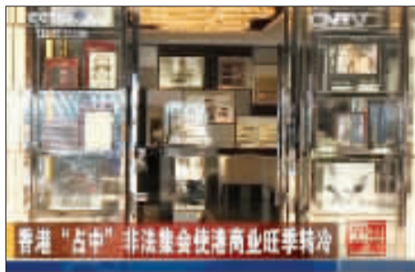
香港一部分人发动的“占领中环”非法集会自9月28日登场以来，对香港金融、旅游、出行等造成恶劣影响。