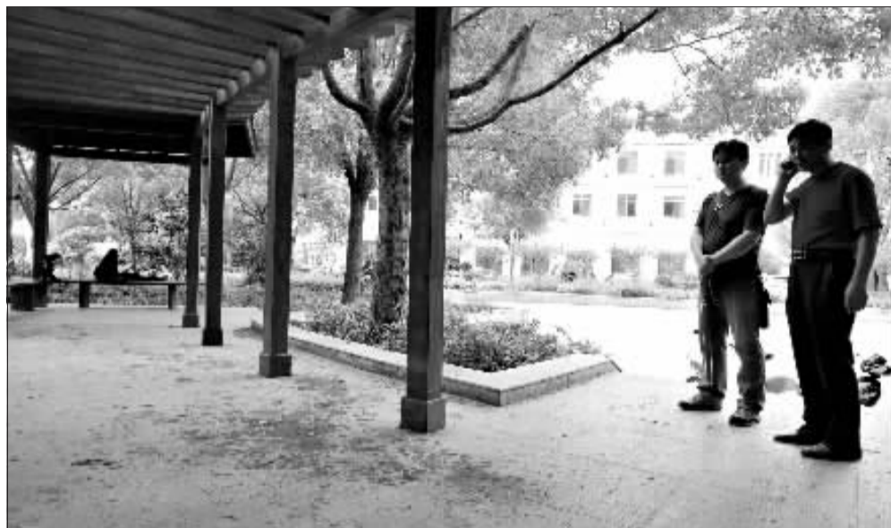
昨天,记者来到事发现场,仍然可以看到血迹。