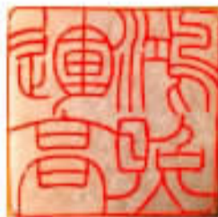
名瑶篆刻“玛瑙高瑞”