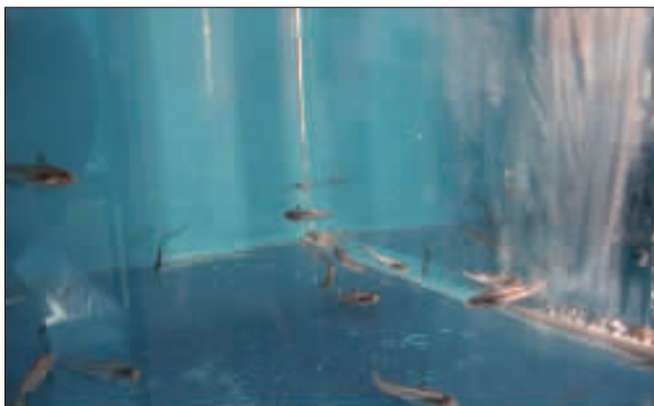
上海在全国率先繁育出人工刀鱼。