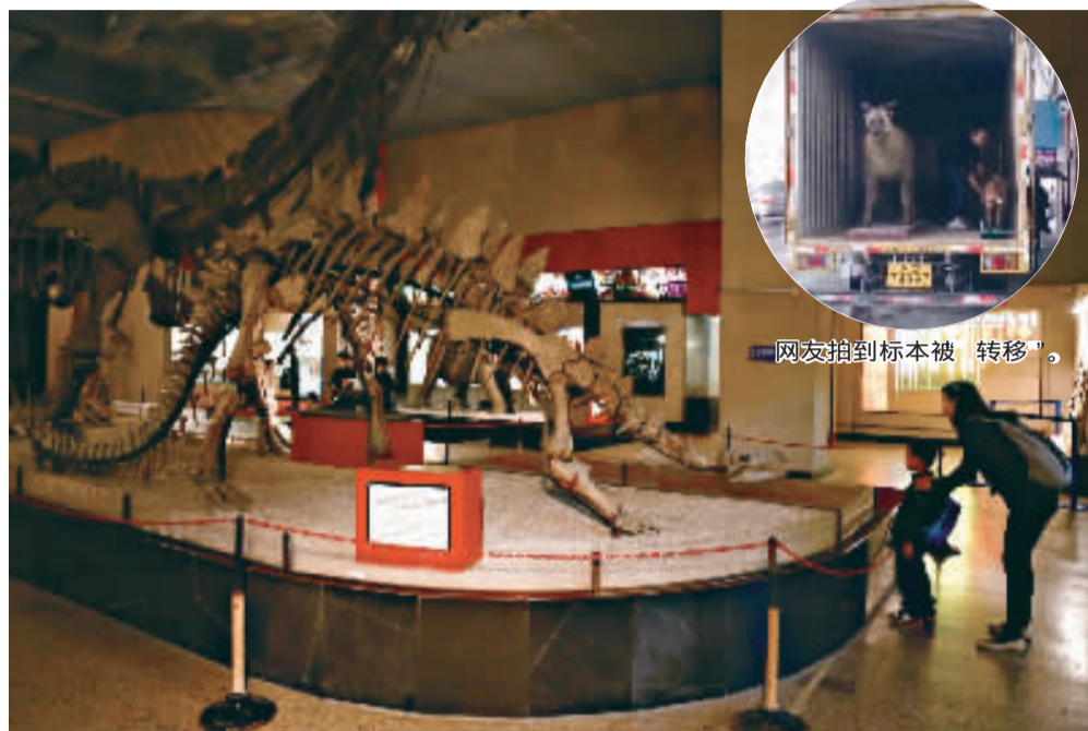
昨天，市民们正在自然博物馆参观。

此外，1730例只代表申请数量，不代表实际生育数量。根据上海以往再生育情况，专家预测，未来5年的实际增长数有可能在7.5万至15万之间。“如果按照这个月的水平保持下去的话，应该是相当于我们预测的低档水平，当然也要看以后的发展。”