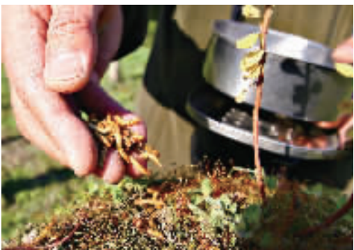
爱好者买来面包虫,吸引小鸟。