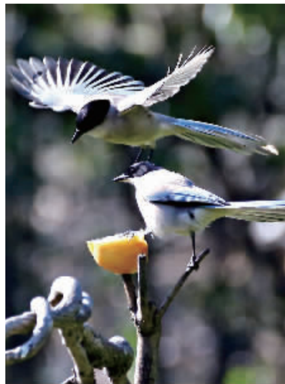
小鸟食用爱好者准备的美食。