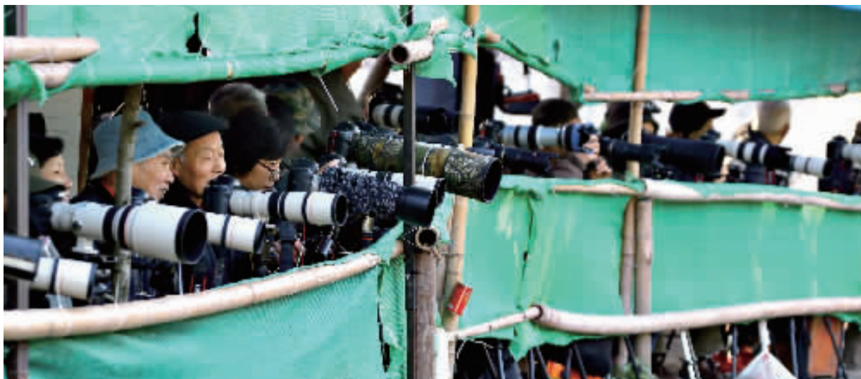
每天清晨,摄影区都会聚集众多爱好者。

这几日,春天的气息扑面而来,也是鸟儿们交配繁殖的好季节。偶然的的机会,记者看到一组非常出色的鸟儿照片,一打听,原来是申城一群热衷于拍摄小鸟的爱好者的作品,这些爱好者把拍鸟的行为俗称“打”鸟,还在市区自发形成多个“打”鸟点。记者随即探访了其中几处,共同体验了一回“打”鸟生活。