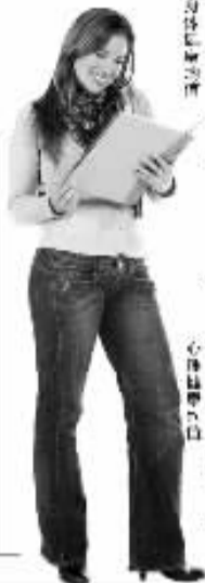
来自不同地区学生的身心健康值