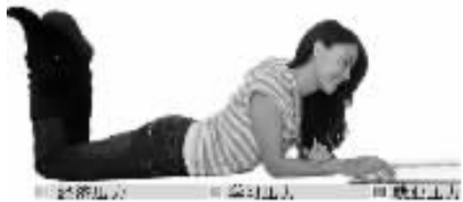
不同地区大学生的压力值