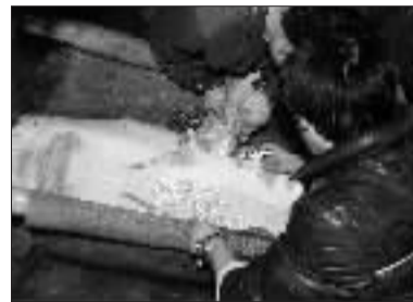
中华鲟正在接受治疗。

本报讯 经过连续数天的抢救,上周四凌晨,被误捕的中华鲟终于开始持续游动,基本脱离生命危险。中华鲟保护区管委会工作人员表示,管委会将对其进行持续监测和治疗,等身体状况完全恢复后,择机放归长江口。