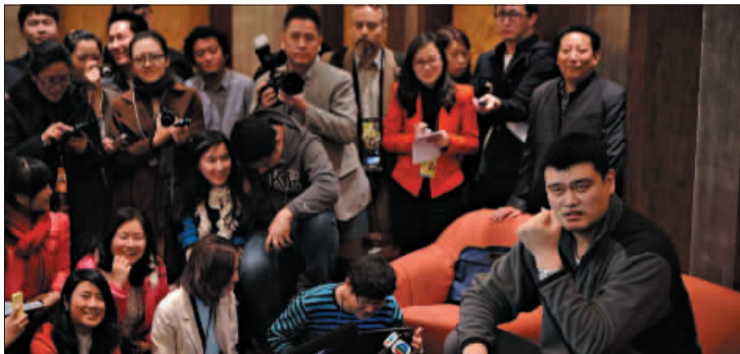
昨日的一场针对姚明的发布会,现场涌进了近百名记者,足以证明他的魅力。

李彦宏还表示,目前使用大数据面临两大问题,一是对大数据的认识问题和运用习惯,二是使用效率问题。