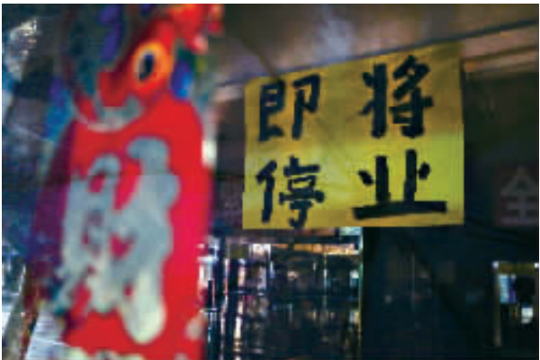
现在，淮海路上到期招租及停业广告随处可见。

淮海路商业街，西起陕西南路，东至西藏南路，这里老字号食品香气逼人，百货店琳琅满目，各种奢侈品让人“弹眼落睛”。在过去一百多年里，淮海路淋漓尽致地展现了这座城市独有的人文底蕴与商业气息，也成为不少老上海人心中浪漫与时尚的代名词。可就是这样一个上海的“老克勒”，最近却遇上了“空铺潮”，短短2.2公里的核心商业区，十余家沿街店铺或空置或租给了“临时甩卖”……这几天的淮海路商铺，也和近日的上海天气一样，有点儿“冷”！