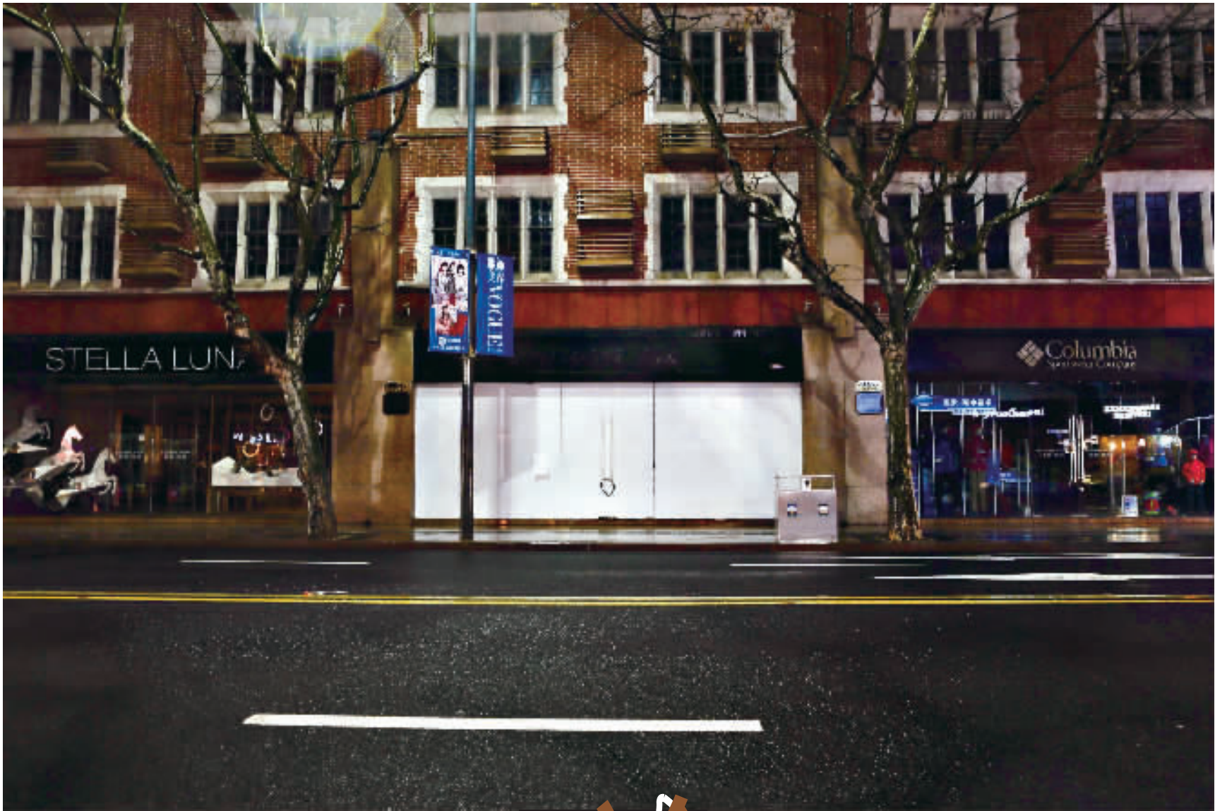
关闭的门面大多用白色或黑色的板纸遮掩。