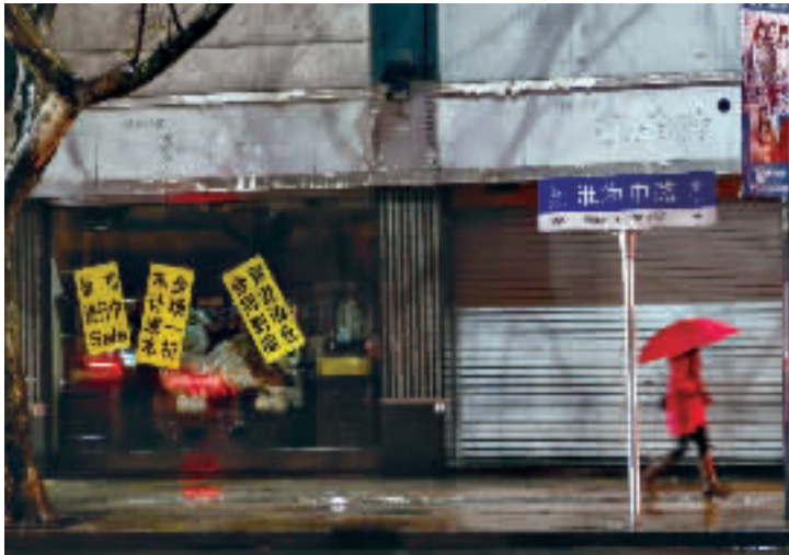
短短2.2公里的核心商业区，十余家沿街店铺或空置或租给了“临时甩卖”。

淮海路商业街，西起陕西南路，东至西藏南路，这里老字号食品香气逼人，百货店琳琅满目，各种奢侈品让人“弹眼落睛”。在过去一百多年里，淮海路淋漓尽致地展现了这座城市独有的人文底蕴与商业气息，也成为不少老上海人心中浪漫与时尚的代名词。可就是这样一个上海的“老克勒”，最近却遇上了“空铺潮”，短短2.2公里的核心商业区，十余家沿街店铺或空置或租给了“临时甩卖”……这几天的淮海路商铺，也和近日的上海天气一样，有点儿“冷”！