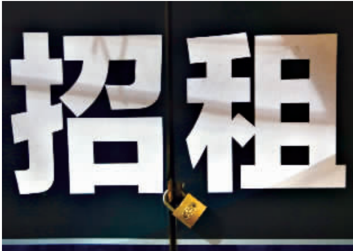
现在，淮海路上到期招租和打折广告随处可见。