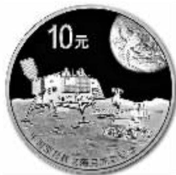
1盎司圆形精制银质纪念币