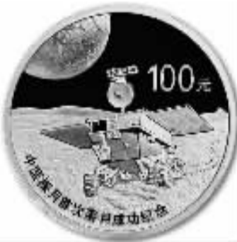
1/4盎司圆形精制金质纪念币