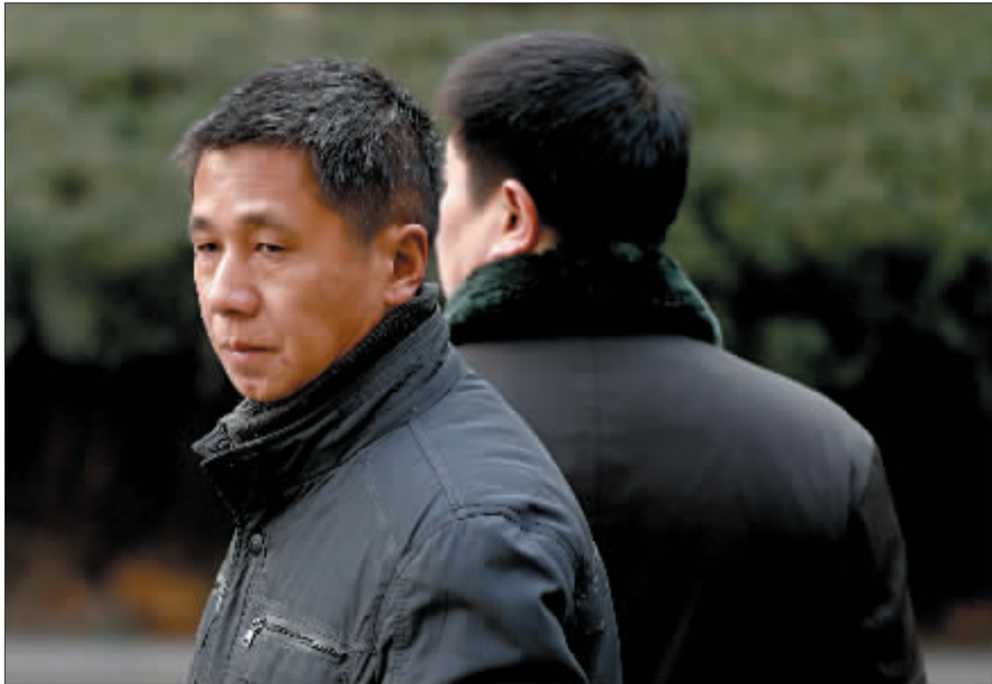
哨兵的父亲欲哭无泪。