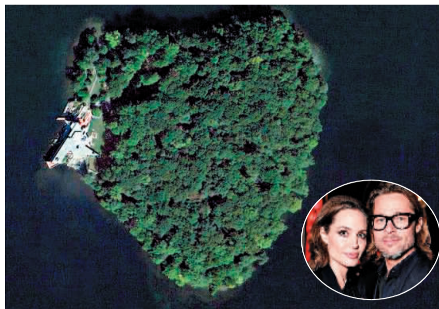
朱莉认为这座小岛有很好的私密性,并且心形的形状对两人有重要意义。