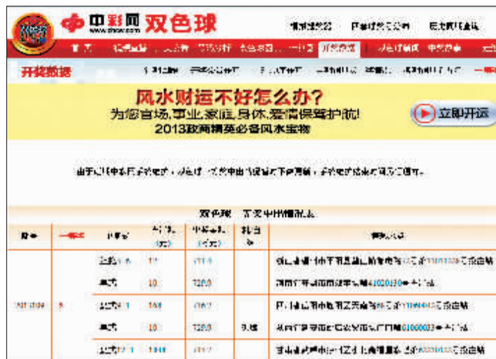
中国福彩中心官网网页截图