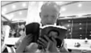
市民正在翻阅。青年报记者 丁嘉 摄

昨天上午,《朱镕基上海讲话实录》由人民出版社和上海人民出版社正式出版发行,并在北京、上海、广州和长沙四地同步首发。上海书城福州路店作为《朱镕基上海讲话实录》在上海的首发之地,昨天人头攒动,前来翻阅购买该书的读者络绎不绝。截至昨天17点57分,上海书城已售出该书平装本1136册、精装本113册,创了近期书城图书销售纪录。