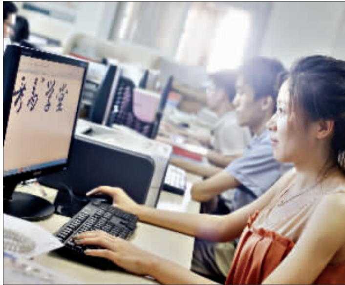
“考易学堂”有一个实时在线的专家团队，传统的答疑、指导，帮助检查作业。

此外，考易学堂还将视线对准了学员的“碎片时间”。“我们即将推出手机客户端，让学员能利用一切碎片时间轻松学习。”