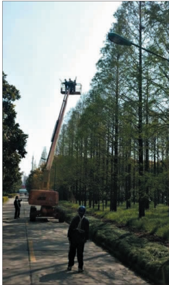
网上流传的交大环卫工“清巢”图。

学校后勤保障处办公室也对外表示，4月3日学校接到上海市下发的关于食堂安全预警通知，当天后勤处便对各个食堂发布了针对H7N9禽流感做好食品安全相关工作预案的通知，其中包括食品原材料进口，严格执行“索证索票”。交大食堂的原料全部是由上海高校后勤统一供应，不会使用周边活禽市场的鸡鸭。食堂员工每天工作前进行晨检，如果出现发热咳嗽等症状则不能上班。在食品加工方面执行更加严格，必须达到规定温度及时长，确保煮熟煮透。