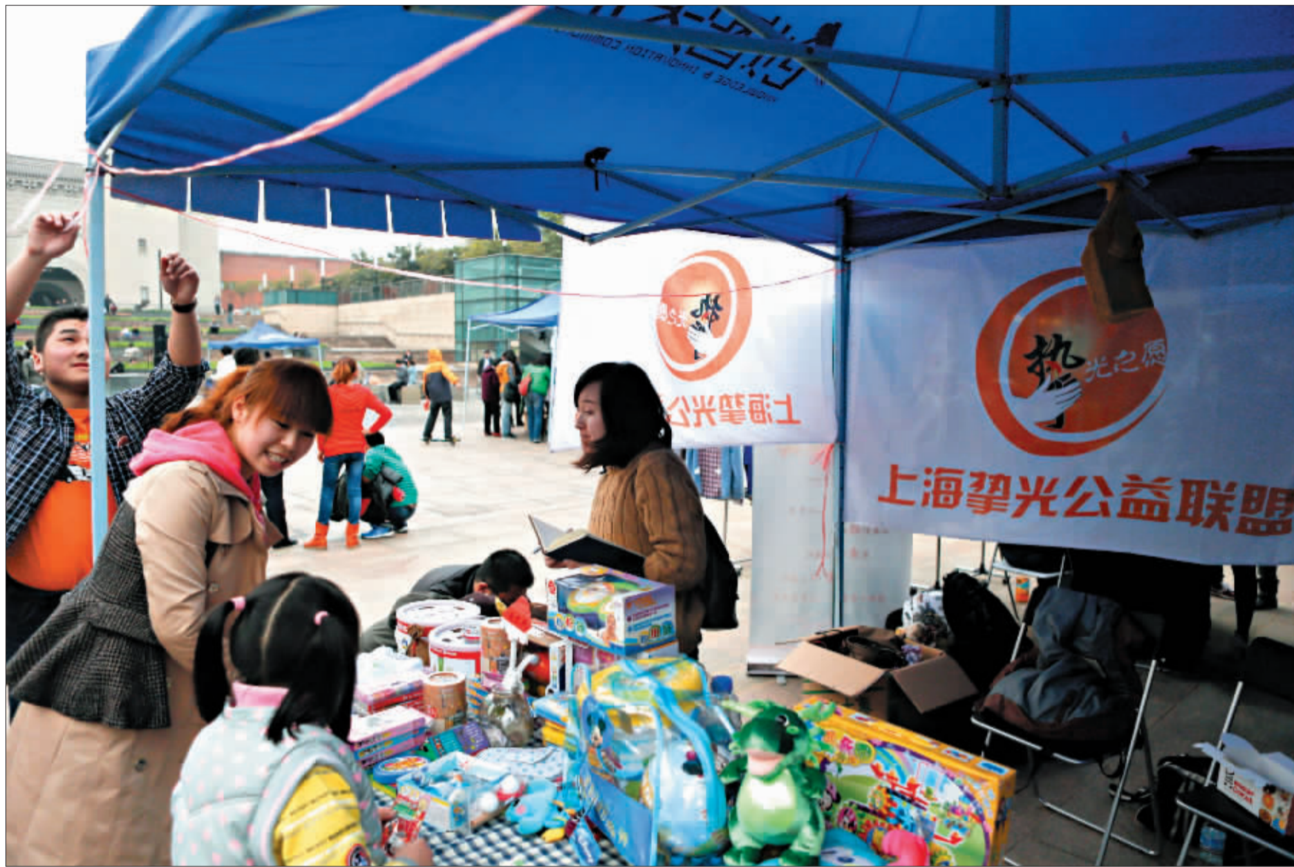
今年3月17日 一家公益组织正在杨浦区创意天地举办的公益集市上摆摊。除了公益组织外 来自全国各地的创意工作室和创业青年也是公益集市 “固定班底”的重要组成部分。