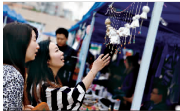
两位买家正在集市上选购饰品 这些独一无二的手工制品实际上大多是 “三无”产品 但买家对此并不介意。

不过 记者在公益集市的走访中也发现了一些乱象。在娄山关路上的一家公益集市 入口处是一家慈善超市的摊位 前排摆出了各种各样的补品 工作人员向记者推荐说 “白参的产地是东北的 西洋参则是从加拿大进口的 因为做公益 所以特价卖。然而记者没看到西洋参的任何包装 问及摊主如何证明这些西洋参是进口