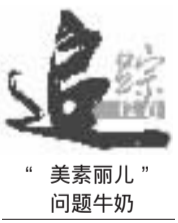
“美素丽儿”问题牛奶

本报讯 记者 王婧 瑞士玺乐集团昨天发布声明,公布了所有从荷兰出口中国的美素丽儿的生产批号,表示消费者可登录网站 www.heronutradefense.cn 查询、辨识产品包装上的生产批号。 记者昨天拨打美素丽儿客服热线得知,如果消费者购买了不在公布的生产批号内的产品,只要在正规渠道购买的、未开封的产品,可前往经销商处办理退货,但热线并未解释为何有产品并不在正批号内,以及有无质量问题。 玺乐集团昨天在其官网上发布声明称,2012年,玺乐集团在中国推出Hero Nutradefense(中文名称:天赋美素。2012年4月前曾用名:美素丽儿)婴儿配方奶粉,所有在中国销售的此款产品均生产于荷兰。 声明中称,近日苏州质监局发现玺乐集团在中国的经销商涉嫌非法改装天赋美素的产品,苏州政府相关部门随即展开调查。此次事件对消费者造成的影响及困惑我们深表遗憾。 玺乐表示,鉴于此,集团也已对所有的在华分销商开展全面调查。公司目前为止没有收到有关我们在华销售产品的质量投诉。