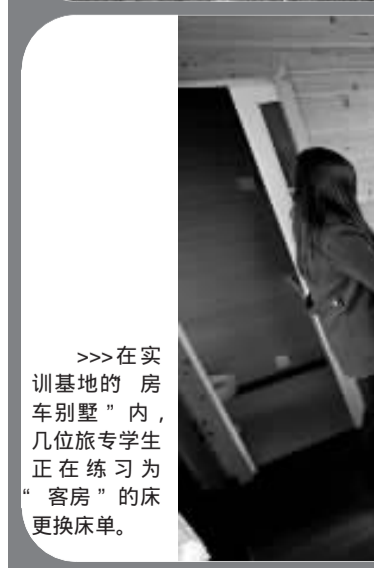
>>> 在实训基地的“房车别墅”内，几位旅专学生正在练习为“客房”的床更换床单。