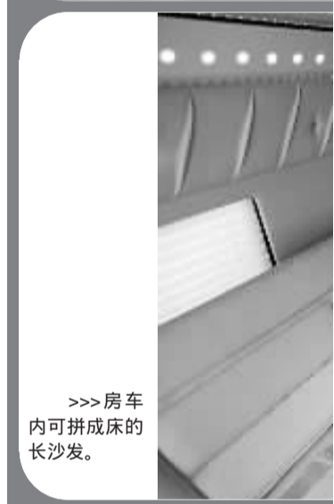
>>> 房车 内可拼成床的 长沙发。