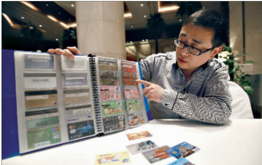
“卡友”随手翻开卡册，成千上万张银行卡跃入眼帘。