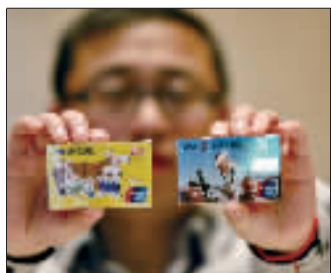
一张薄卡片就可讲述鲜为人知的故事。

“有一段时间在国外，常买U盘，因为样子很特别，后来索性把家里的也存了起来。”沈先生告诉记者，U盘的容量从最初64M、128M这样的小体量发展到16G的大容量，造型也由单一普通变得设计感十足。“偶尔翻出来看看，颇为有趣。”