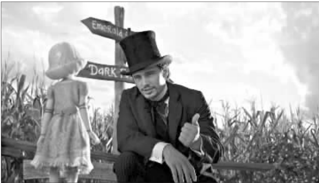
弗兰科：看来我们的魔境之路上金币不少呢！（设计台词）