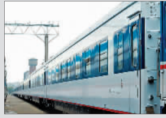
16年来,正是左图中的这趟Z37次列车票价一直未变,6张车票记录了历史。