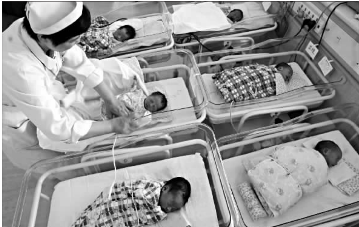
本市去年常住出生人口为22.61万人。