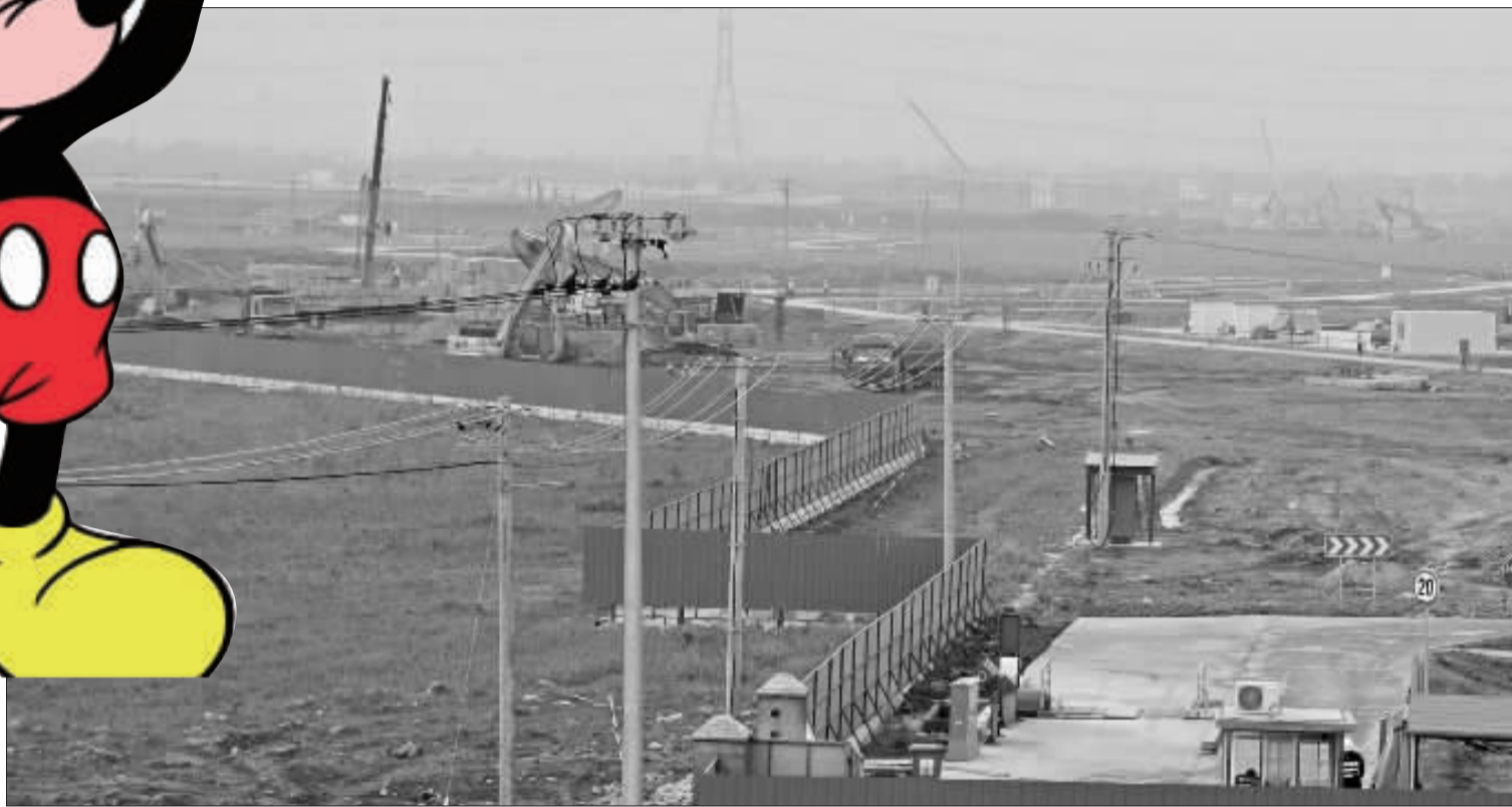
迪士尼项目施工正在如火如荼地进行。