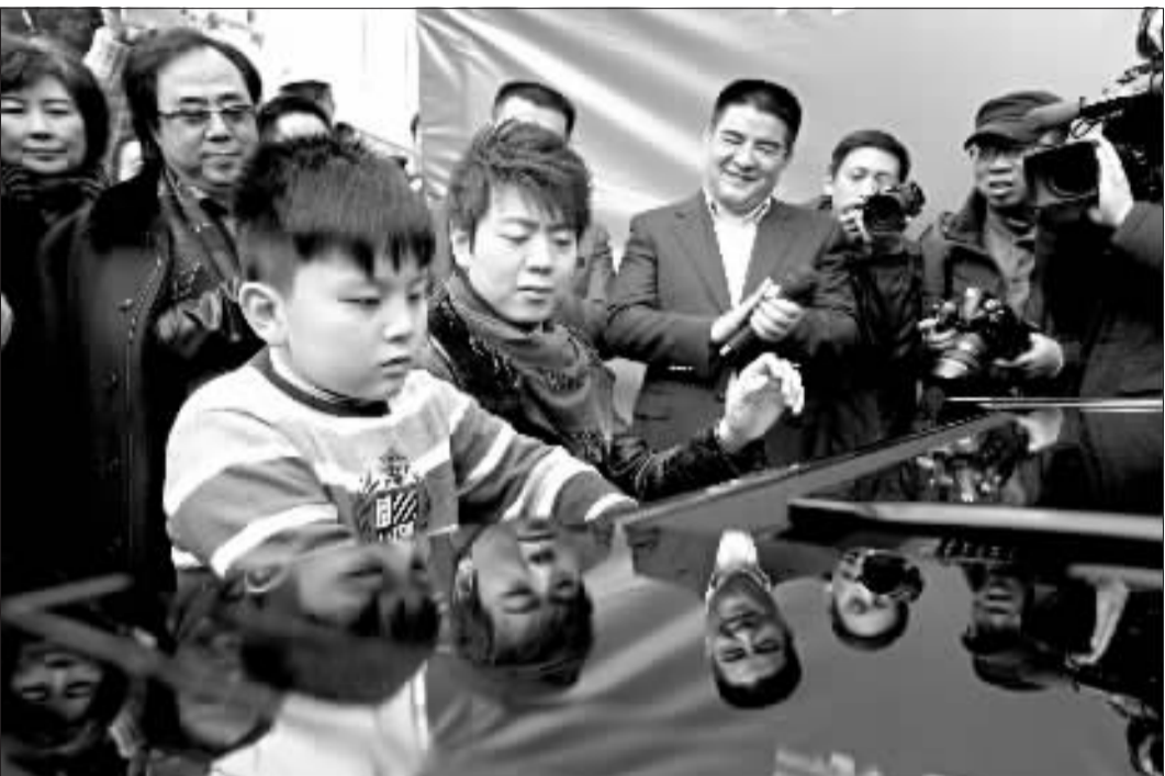
1月12日，陈光标派5000辆自行车倡导环保，朗朗和小朋友一起弹奏钢琴助阵。