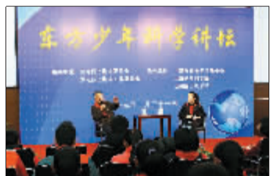
院士面对面。

本报讯 记者 刘晶晶 昨天下午,由团市委、市少工委主办的东方少年科学讲坛之“快乐寒假 院士面对面”活动在上海院士风采馆举行。作为2013年度的首场讲座,此次活动特邀中国科学院院士、高分子化学家、复旦大学教授江明院士与来自上海少年科学院的小院士代表、中学生科技爱好者代表面对面交流、近距离沟通。